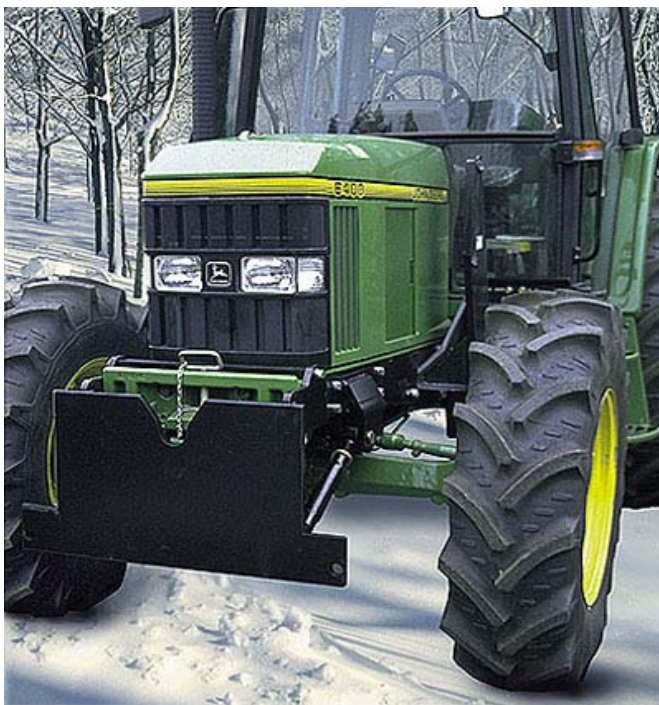
Plogfeste traktor - rammefeste

standardkrav. Er beregnet for tilkobling av ulike snøploger til traktor. Robust og sikker konstruksjon som ikke påvirker traktorens kjøreegenskaper. Leveres som kombifeste eller rammefeste. Kombifestet henges opp i traktorens front og trekkroken brukes som bakre feste og buffert. Rammefestet monteres fra frontlasterbrakettene og framover. Dette gir full bakkeklaring under traktoren, og trekkroken er fri. Plogfestet er ”skreddersydd” hver enkelt traktormodell, oppgi type og årsmodell.